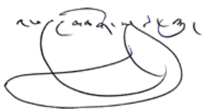
พักชก รินโปเช

สัพพะมังคะลัง (ขอมงคลทั้งปวงจงบังเกิดมี)