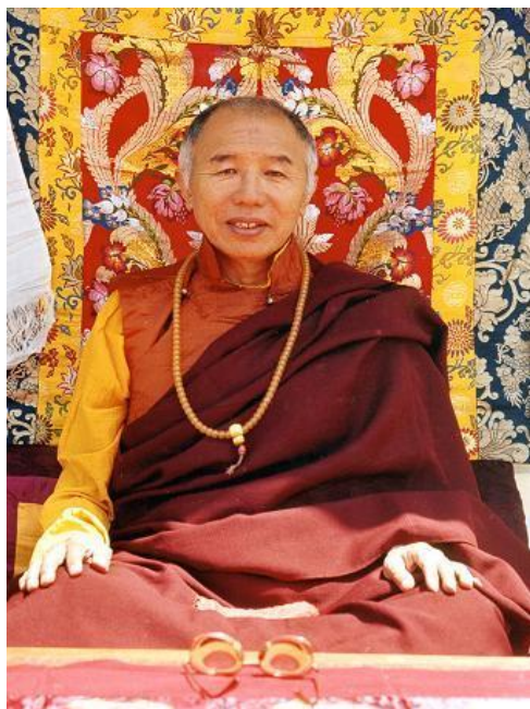
Kyapjé Tulku Urgyen Rinpoche

Em nossa presente era mundial, mil Budas aparecerão. Cada um será acompanhado por uma emanção de Guru Rinpoche para realizar as atividades do Buda. Na era atual do Buda Shakyamuni, todas as atividades do Buda apareceram em uma única emanção na forma de Padmasambhava, o Nascido do Lótus.