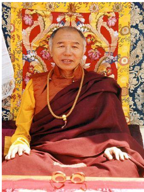
К'ябдже Тулку Ург'єн Рінпоче

У нашу нинішню епоху з'явиться тисяча Будд. Кожного супроводжуватиме еманация Гуру Рінпоче, який вершитиме просвітлені діяння Будд. У наші часи Будди Шак'ямуні всі діяння Будди проявилися в одній еманацияї — у Падмасамбгаві, Лотосорожденному.