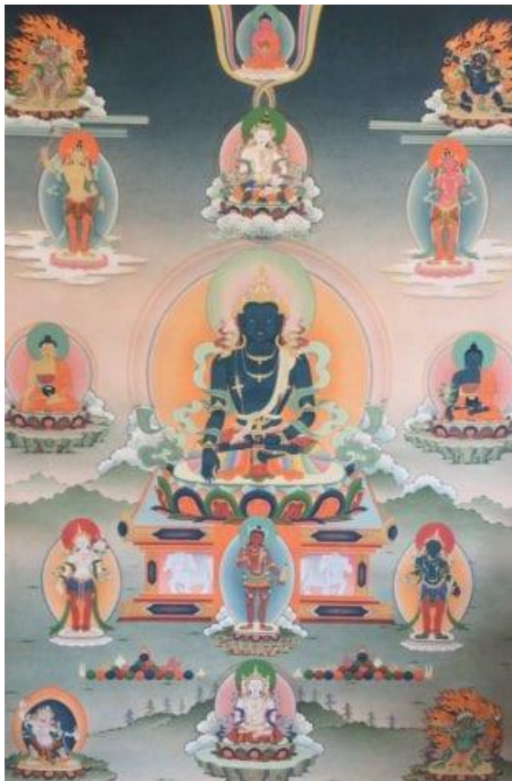
พระเนนชง ดงตຽຽກ

บทชงกิก โดร์เซ็ม เป็นบทปฏิบัติพระวัชรสัตว์ ที่รวม พระพุทธเจ้าทุกพระองค์ของทั้งห้าพุทธสกุล พระ วัชรสัตว์เป็นพระพุทธเจ้าที่รู้จักกันดีว่าสามารถ ชำระล้างได้ทั้งเหตุชั้นลึกแห่งกรรม มลทินและกิเลส ต่างๆ ทั้งหมดให้บริสุทธิ์