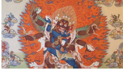
บทปฏิบัติบาร์โด - แบบเต็ม

กรุณาคลิกที่แบบฟอร์มนี้ เพื่อขอให้ปฏิบัติสำหรับผู้ล่วงลับ