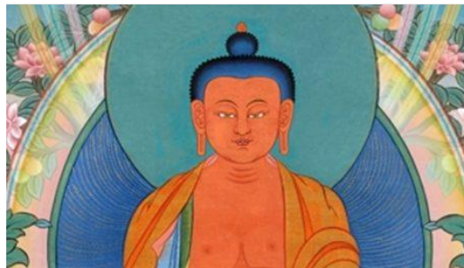
บทปฏิบัติบาร์โด - ครั้งเดียว

กรุณาคลิกที่แบบฟอร์มนี้ เพื่อขอให้ปฏิบัติสำหรับผู้ล่วงลับ