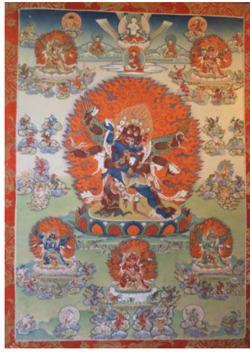
พระกวนซิ่ง ทุกทิก (ปางพิโรธ)

บทปฏิบัติกวนซิ่ง ทุกทิก เป็นแก่นหัวใจของพระสมันตภัทร บทนี้อยู่ในคำสอนชกเซ็นและรวมการถวาย บูชาแต่เทพ 100 องค์เพื่ออุทิศและช่วยให้วิญญาณในบาร์โตนหลุดพ้นได้