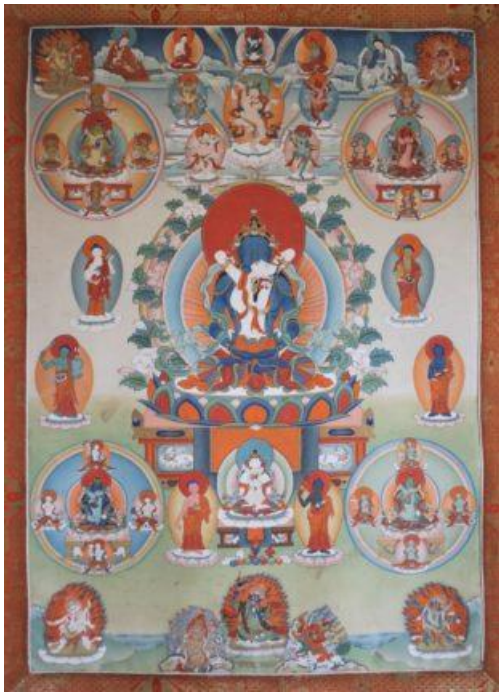
พระกวนซิ่ง ทุกทิก (ปางสันติ)

พระอมิตาภพุทธเจ้า เป็นที่รู้จักกันในผู้ปฏิบัติ มหายานและวัชรยาน ว่าเป็นพระพุทธรูปผู้ตั้ง ปณิธานก่อตั้งพุทธเกษตรสุขาวดี ให้สรรพสัตว์ได้ไป เกิดใหม่ในพุทธเกษตรนี้ พิธีบูชานี้จะช่วยให้ผู้ ล่วงลับได้ชำระกรรมที่ไม่ดี สิ่งสมบุญกุศล และสร้าง บุญสัมพันธ์กับพระอมิตาภเพื่อขอให้พระองค์รับผู้ นั้นเข้าสู่พุทธเกษตรของพระองค์