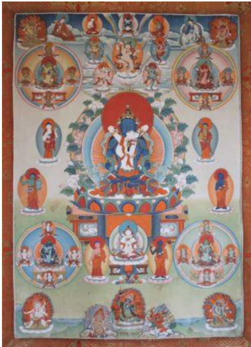
Kunzang Tuktik (Peaceful)

Amitabha Buddha ist unter Mahayana- und Vajrayana-Praktizierenden sehr bekannt als der Buddha, der das Wunschgebet machte, den reinen Bereich von Sukhavati, das reine Land der großen Glückseligkeit, zu manifestieren, damit die Wesen dort wiedergeboren werden können. Diese Puja im Namen des Verstorbenen zu machen reinigt negatives Karma, sammelt Verdienst an und verbindet sie mit Amitabha, um dem Verstorbenen zu helfen, in Amitabhas reinem Land wiedergeboren zu werden.