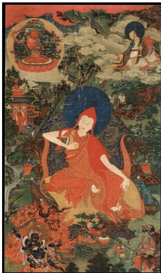
Hình ảnh: Sakya Pandita, bản quyền của Himalayan Art Resources .